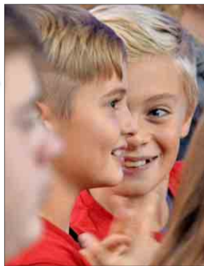
Werden wir wohl unter den Gewinnern sein?