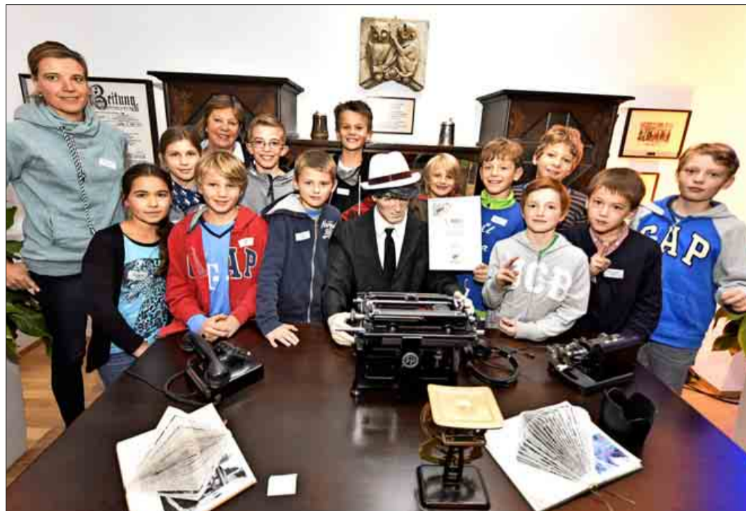
Glückliche Scoop-Gewinner im BZ-Museum: Den ersten Preis in der Kategorie Grundschule gewann die Redaktion der Zeitung „Schulgeflüster“ (unten) der Emil-Thoma-Schule, Freiburg.

tungen beworben. Eine Fachjury hat sie bewertet. Gestern nun wurden die besten Schülerzeitungen in den Kategorien Grundschule und Weiterführende Schule ausgezeichnet.