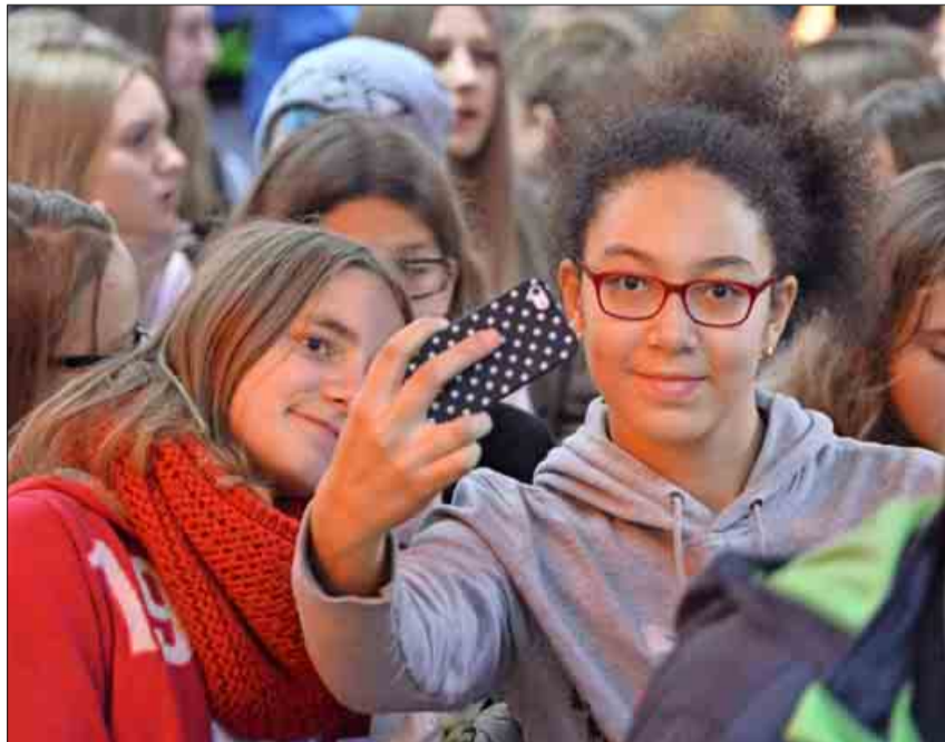
Die Spannung steigt, aber Zeit für ein Selfie ist immer.

Redakteurin „Zeitung in der Schule“ der Badischen Zeitung