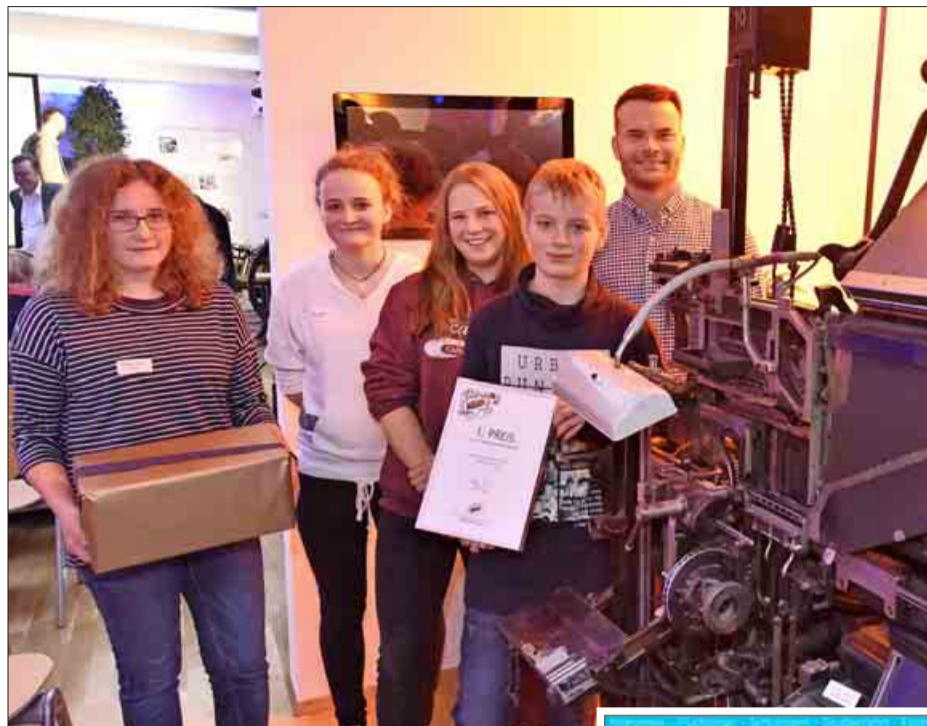
Sieger der weiterführenden Schulen wurde das Hebel-Gymnasium Lörrach mit „Hebelwirkung“.