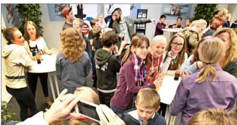
Ganz schön wuselig wurde es in der Pause, als sich die Schülerreporter bei Getränken austauschen konnten.

Bei der Scoop-Preisverleihung wurde aber nicht nur geredet, sondern auch getanzt, getrunken und gegessen. Los Desperados, so der Name der 15-köpfigen Breakdancegruppe, wirbelte zu HipHop-Beats über das Parkett.